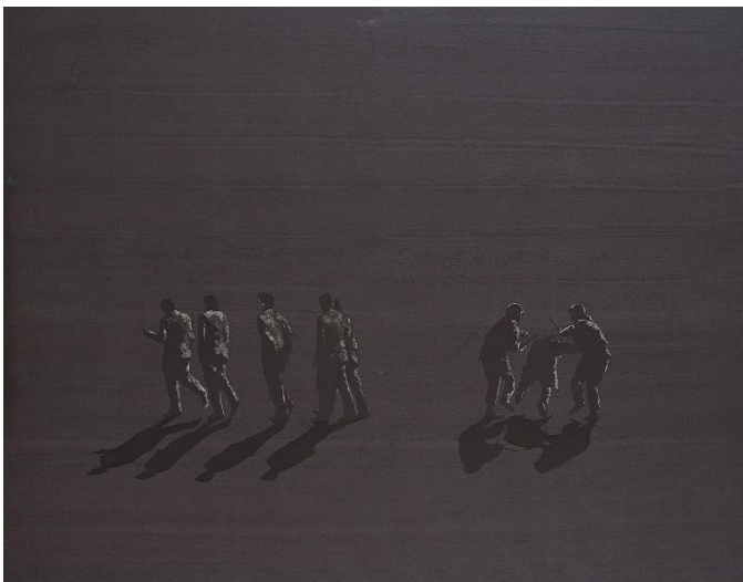
Juan Genovés. Los que golpean , 1973. Acrílic sobre llenç, 145 x 185 cm.