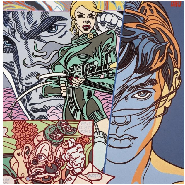
Erró. Poder de acción , 1991 [Serie Evil Clown ]. Acrílico sobre lienzo, 100,5 x 100,5cm.