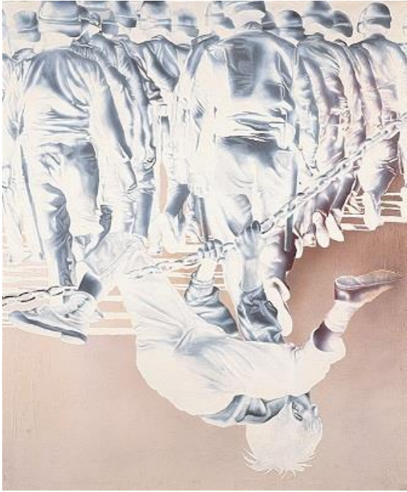
José Luis Verdes. Antípodas , 1972 Óleo sobre lienzo, 160 x 133 cm.