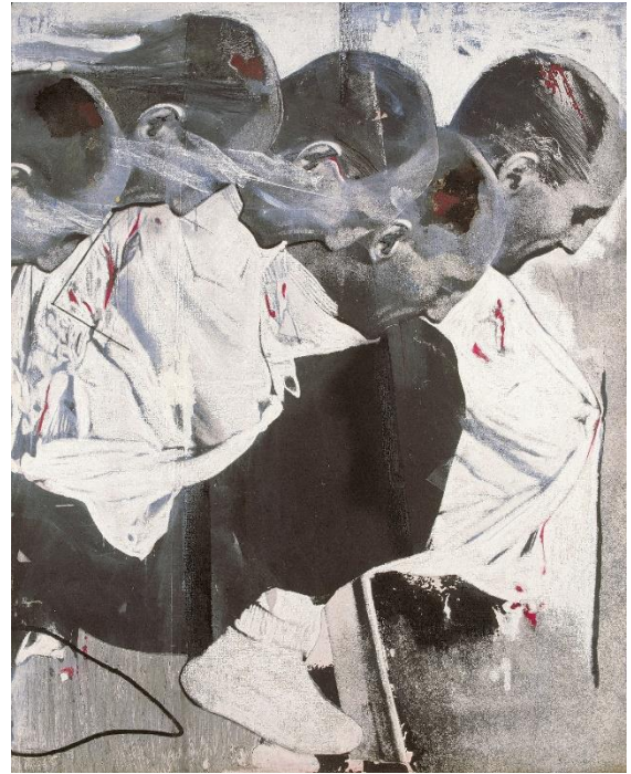
Darío Villalba. Redención / Velocidad I , 1980 Óleo, emulsión fotográfica y cera sobre lienzo, 200 x 160 cm.