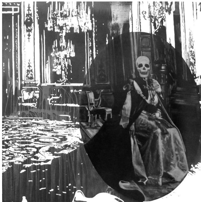
Mavi Escamilla. Señora B , 2010. Encáustica y tinta china sobre lienzo, 190 x 190 cm. 12ª Bienal M.G. / U.V.