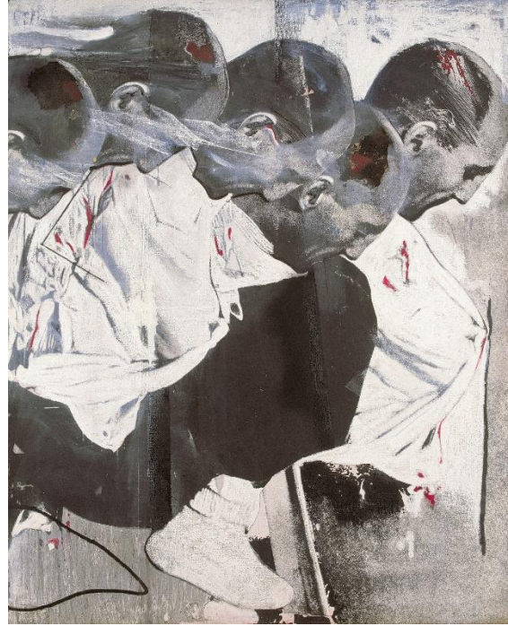
Darío Villalba. Redención / Velocidad I , 1980 Oli, emulsió fotogràfica i cera sobre llenç, 200 x 160 cm.