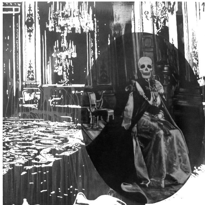
Mavi Escamilla. Señora B , 2010. Encàustica i tinta xinesa sobre llenç, 190 x 190 cm. 12a Biennal M.G. / U.V.