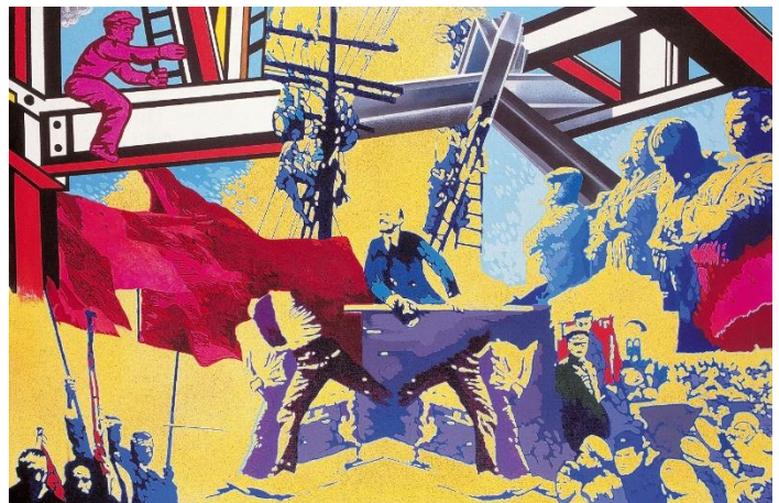
Giangiacomo Sapadari. Costruzioni , 1970. Acrílico sobre lienzo, 150 x 230 mm.