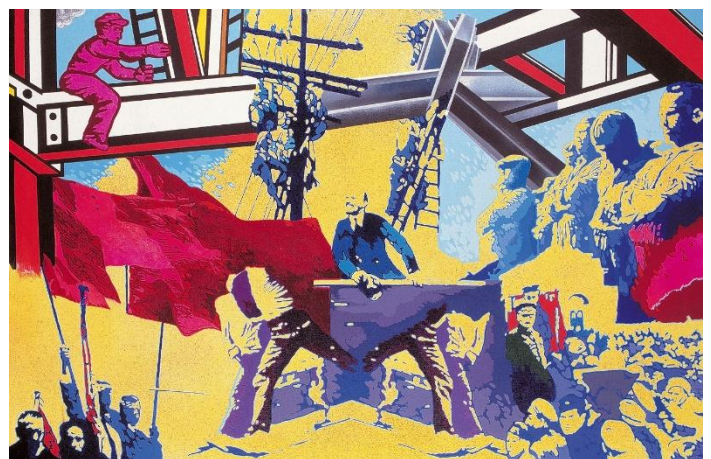
Giangiaco Sapidari. Costruzioni , 1970. Acrílic sobre llenç, 150 x 230 mm