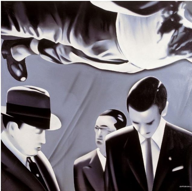
Equipo Crónica. Reconocimiento del cadáver de Calvo Sotelo por el juez de guardia y el médico forense en el cementerio de la Almudena en Madrid en julio del 36, 1974. [Sèrie Hazañas bélicas. Cuadros de historia ]. Oli sobre llenç. 140 x 140 cm.