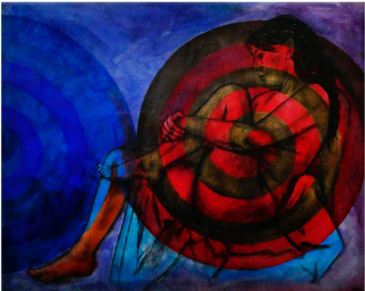
Hoy hace mareta (2024)

Mientras recorremos la muestra expositiva, podemos advertir la evolución que ha experimentado el artista, tanto en el tratamiento de la figura representada como en la técnica, hasta conseguir este nuevo dialecto para poder expresar de manera plástica lo que quiere: la dualidad en el punto de vista. ¿Por qué recurre a los símbolos, cuando la representación de la figura humana es suficiente? El artista busca que el espectador se acerque a la obra, no mostrarla de una manera fácil y obvia, y al mismo tiempo utiliza los símbolos para preservar la intimidad de la figura.