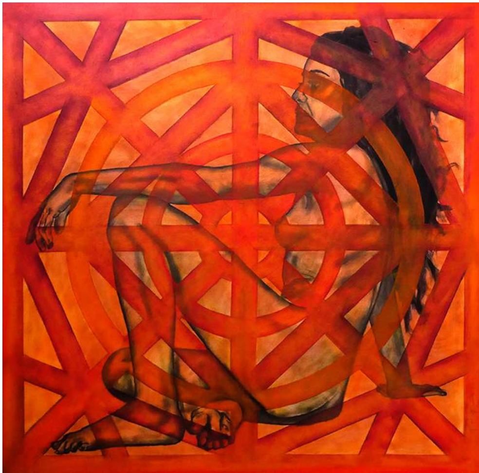
La pasiencia (2024)

Este conjunto de 32 obras es una selección de una grandísima colección que consta de un total de 288 pinturas que pinos ha ido creando a lo largo de más de 10 años de incesante trabajo. En esta exposición nos vamos a encontrar pinturas en las que la figura humana, casi siempre femenina -la esencia-, se ve parcialmente cubierta por distintos símbolos que tienen relación con la vida personal del artista: laberintos, espirales, hojas, estructuras y letras.