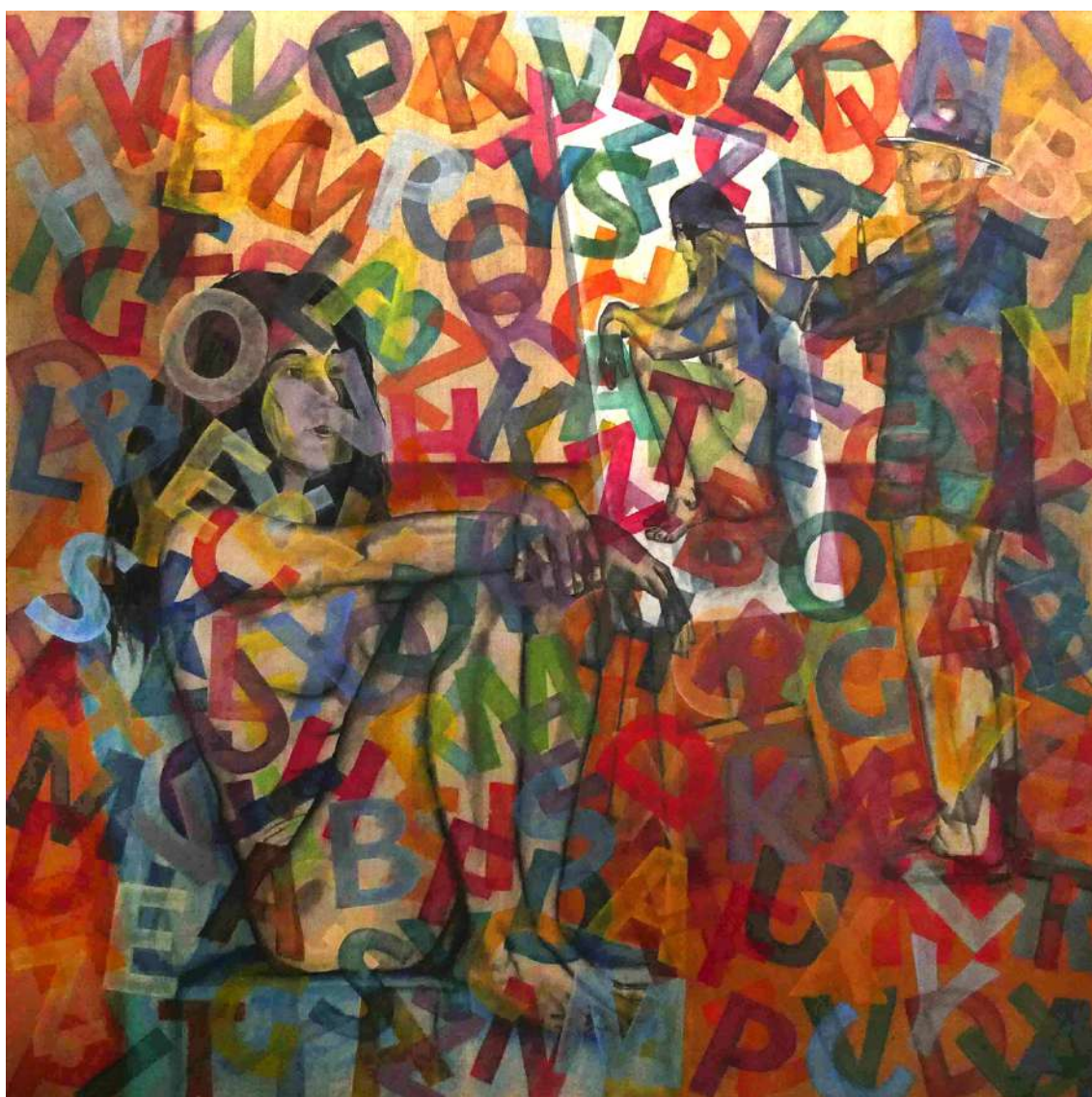
Akaba que metengokir (2024)

La exposición culmina con una obra premiada en el Concurso de Arte Manolo Valdés en el año 2024, hoy propiedad de la Comisión Delegada de Fundación Bancaja en Segorbe, que actúa como punta visible de todo este proceso. Símbolo y esencia no propone respuestas cerradas, sino una experiencia individual: mirar despacio, perderse en los símbolos y, quizá, reconocerse en aquello que está parcialmente oculto.