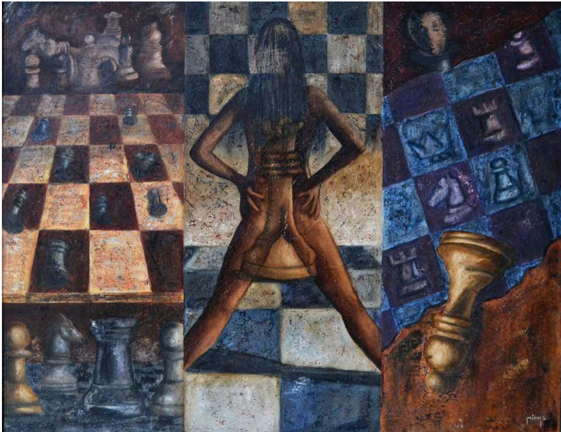
Partida multinivel con dos reinas (1995)