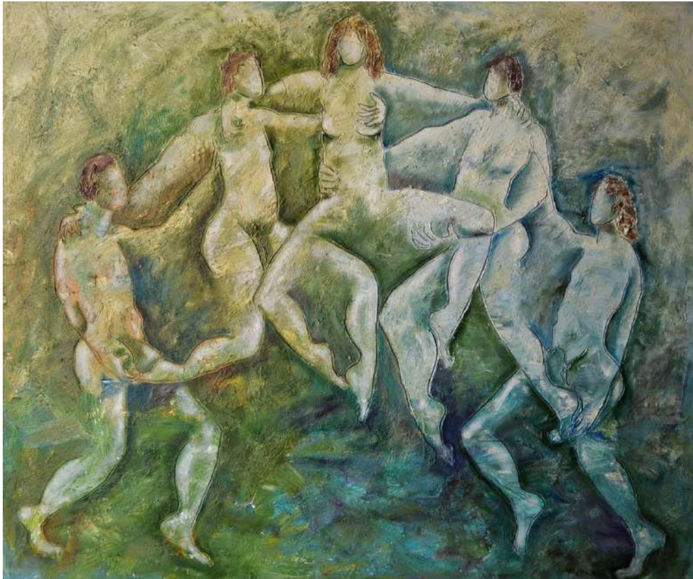
El genio de la lámpara y los deseos de la reina (1995)

Hay un elemento que tiene particular relevancia en toda la obra de pinos, y es el título de la obra. En este momento cargado de originalidad e ironía, el ocurrente artista se divierte a la hora de poner título a sus piezas, se siente libre una vez más y no hay mejor manera de culminar una obra.