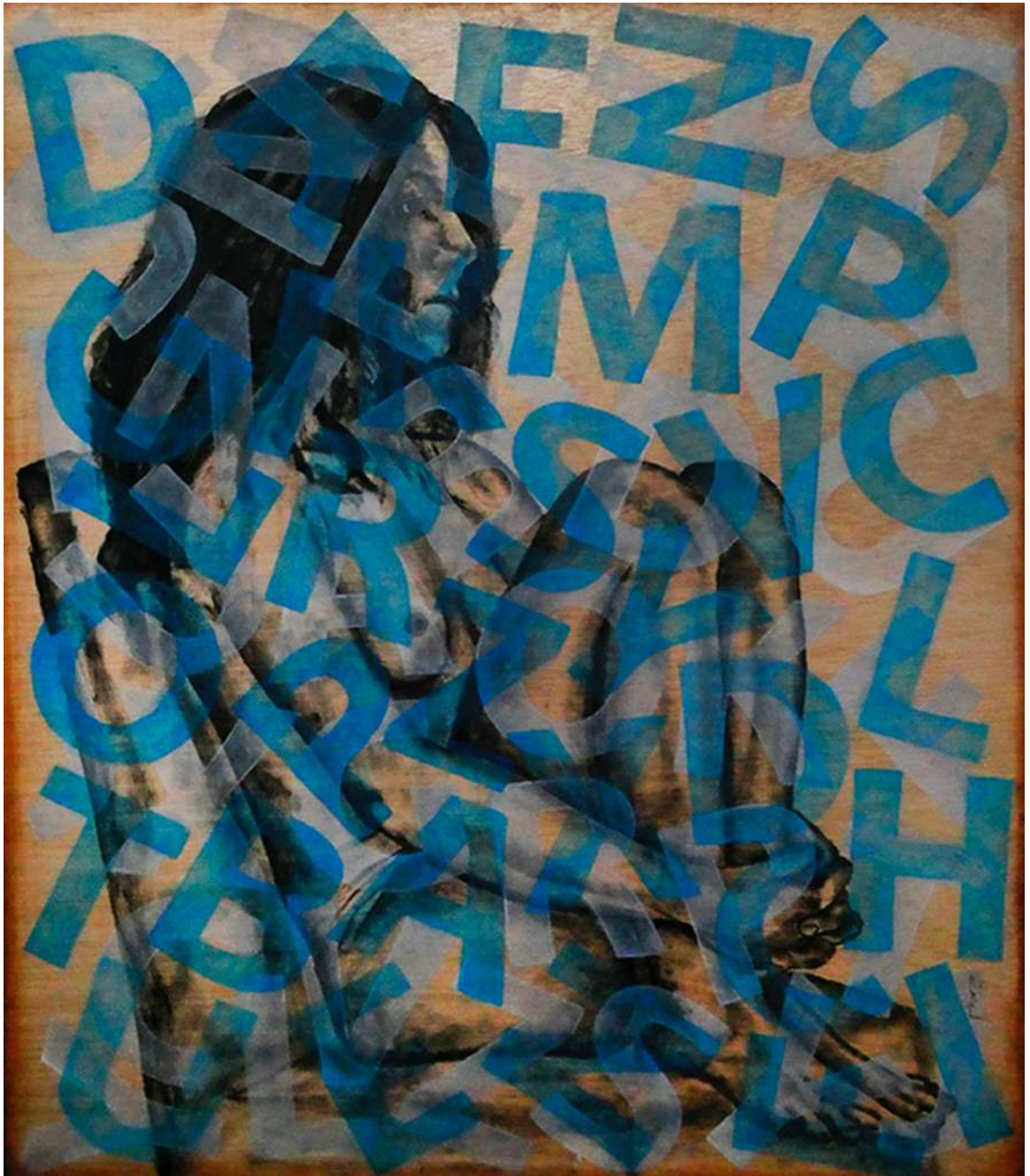
Me da igual que haya hielo (2024)