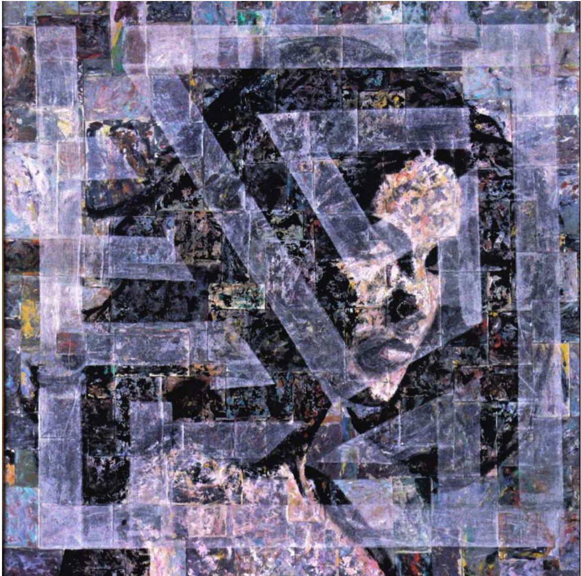
Laberinto fácil y una señora que no es de por aquí (1994)

La obra de pinos ha resultado premiada en varias ocasiones en concursos internacionales como el José Camarón de Segorbe o el Manolo Valdés de Altura, además de haber recibido numerosos accésits y menciones de honor.