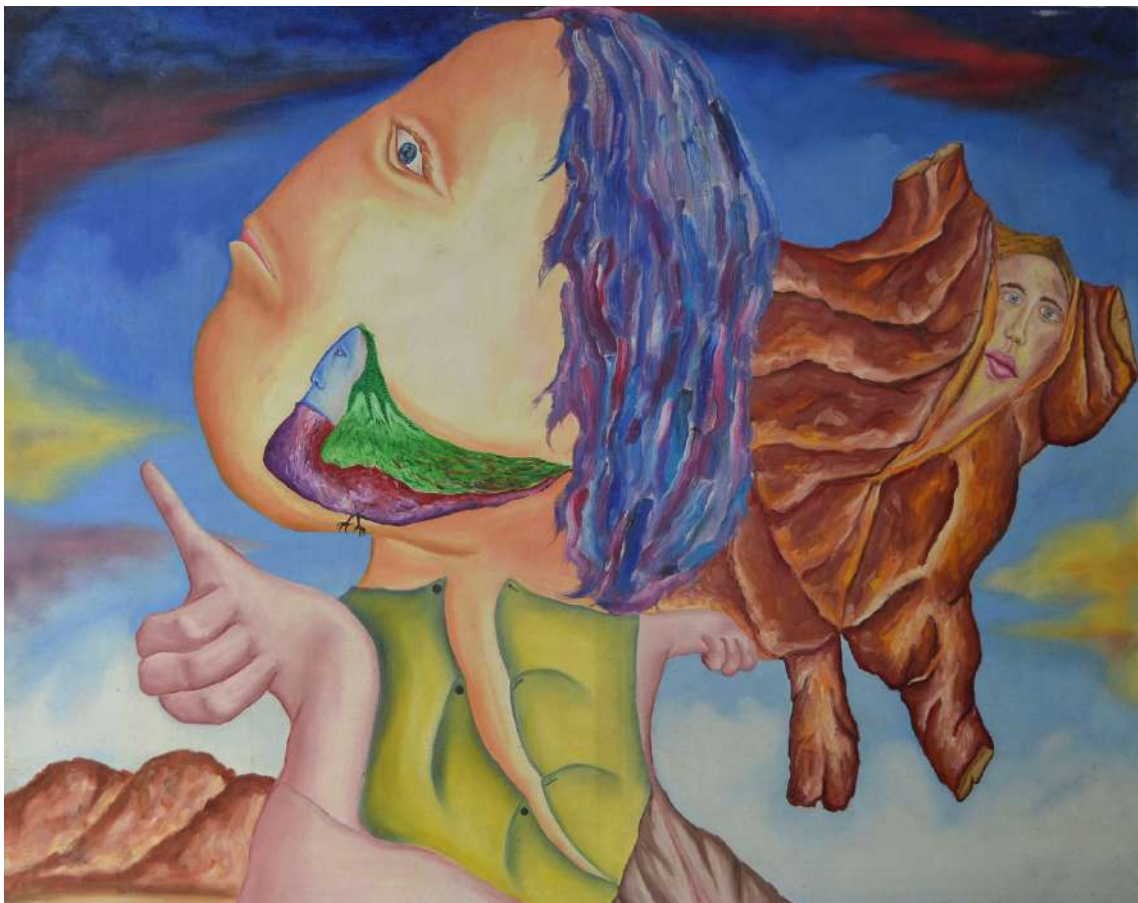
Relación amistosa (1986)

Respecto a su estilo, si bien es cierto que trabaja con lenguajes lo más propios posibles, su trabajo se ve claramente influenciado por artistas surrealistas como Salvador Dalí o Max Ernst, apreciándose igualmente el influjo de otros referentes como el Bosco, Gustav Klimt, Egon Schiele o María Blanchard.